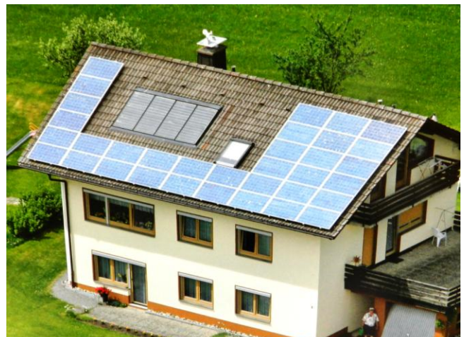
Die Anlage in Kappel aus der „Hubschrauberperspektive“.