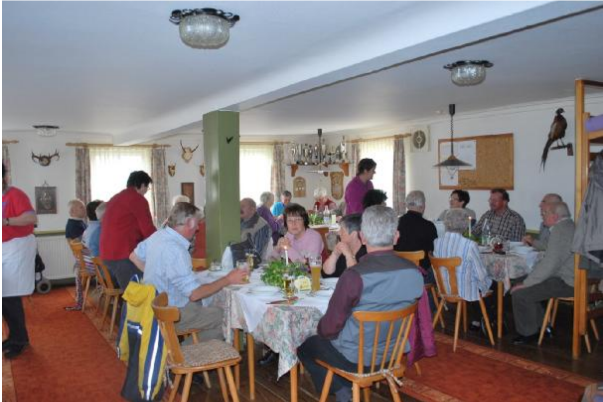
Abbildung 1 1.Seniorenmittagstisch in Gasthaus Adler Oberkollbach