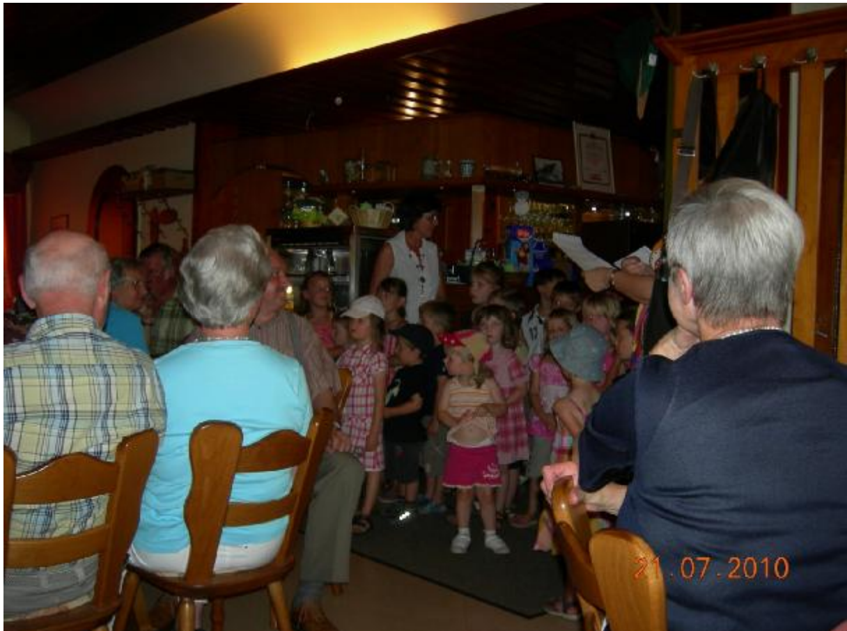
Abbildung 3 Kindergartenkinder aus Würzbach singen den Senioren föhliche Lieder und schenken ihnen eine "Fleißkarte" wie es frühe gute Schüler von den Lehrern bekamen.