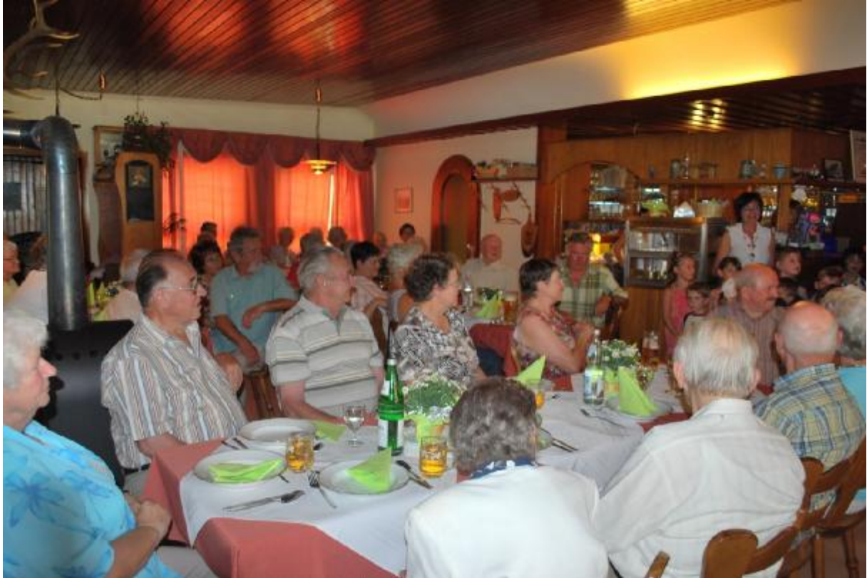
Abbildung 4 Seniorenmittagstisch in Gasthaus Hirsch, Würzbach