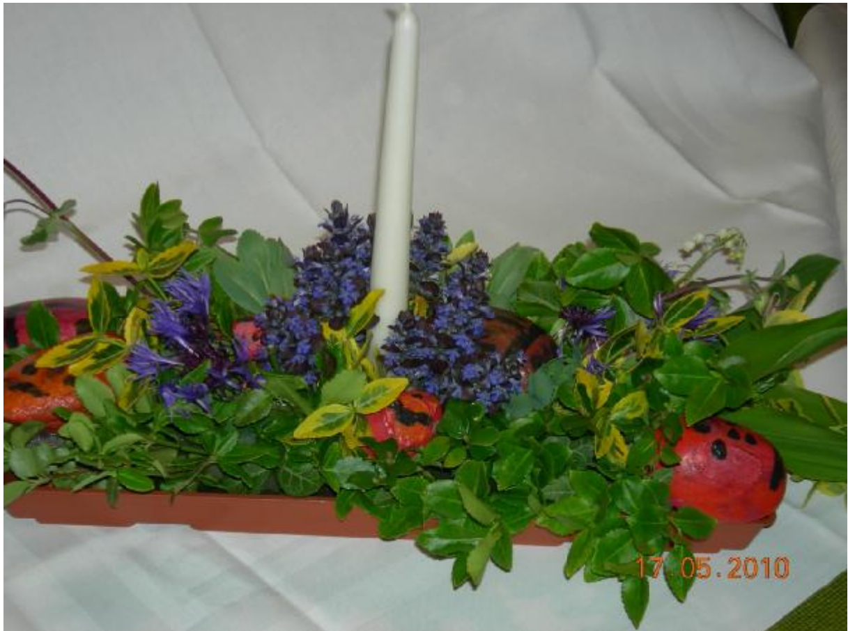
Abbildung 2 Tischgesteck für Seniorenmittagstisch gestaltet von den Kindern des kommunalen Kindergartens Oberreichenbach